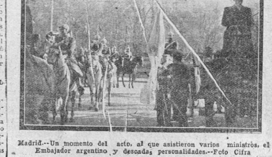
Madrid. — Un momento del acto, al que asistieron varios ministros, el Embajador argentino y decenas de personalidades.