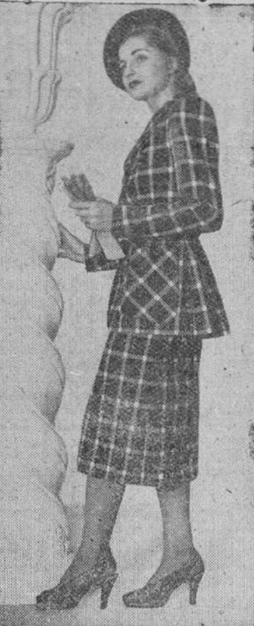
Un bonito vestido de dos piezas con falda larga y chaqueta, última creación de un famoso modisto londinense