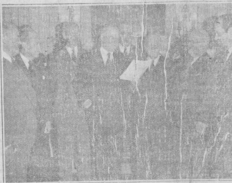
Nueva York.—El ex-premier de los Estados Unidos, Herbert Hoover, en el centro, da lectura a una carta en la que se le felicita por los resultados de su viaje a Europa, para resolver la cuestión alimenticia.