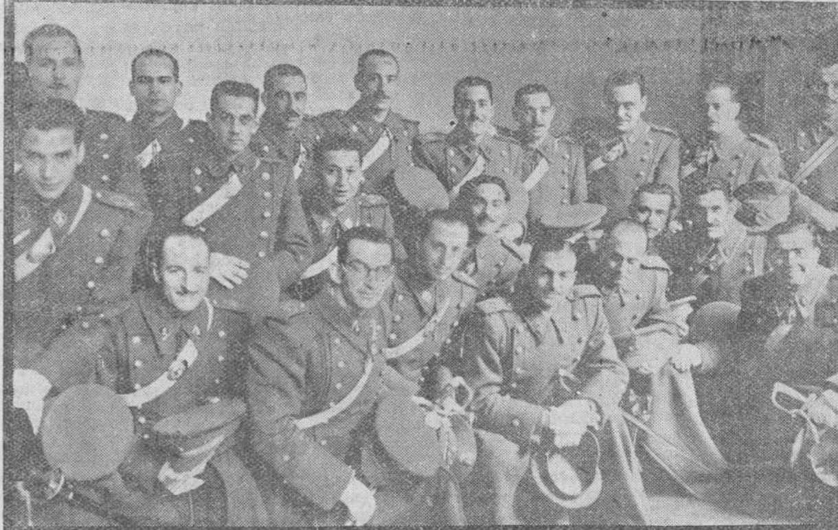
Ayer se celebró en la Academia de Ingenieros, la entrega de despachos a los nuevos Oficiales del Arma. Terminado el acto, nuestro fotógrafo obtuvo un grupo de los Caballeros Cadetes que han concluido sus estudios en la Academia de Burgos. Con ellos aparecen algunos de sus profesores.