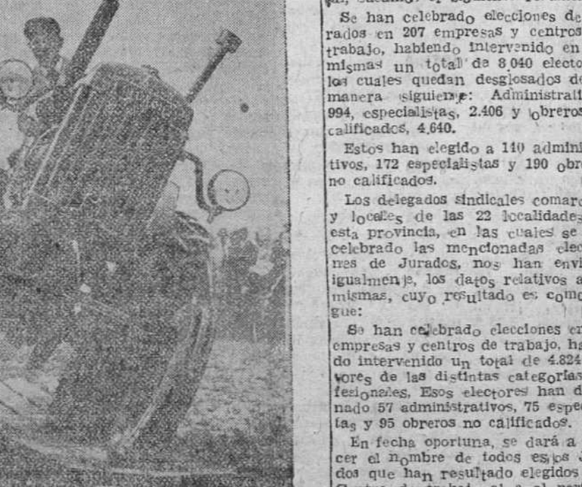
En una granja agrícola inglesa se realizan pruebas satisfactorias de este nuevo modelo de tractor, adaptable a todos los terrenos...