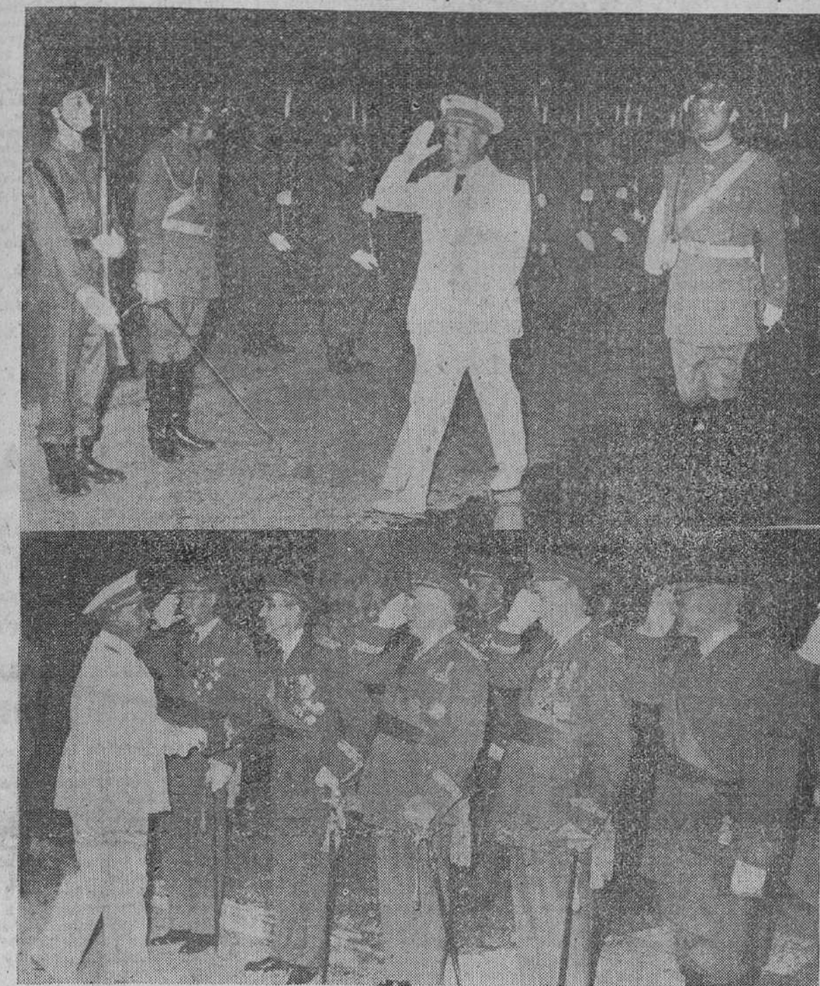
El Caudillo, pasando revista a las tropas del Regimiento Infantería "San Marcial", que le rindieron honores a su llegada a Burgos. En segundo plano, aparece S. E. el Jefe del Estado estrechando la mano de los generales que presidían las comisiones militares, en el jardín de la residencia de La Isla.

Con S. E. llegó asimismo la primera dama de España, doña Carmen Polo