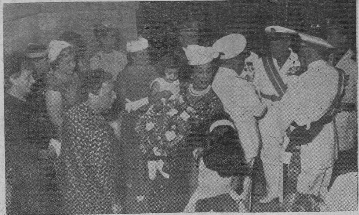
A la puerta del palacio de la Isla, los nietos de S. E., que se encontraban ya en Burgos, acudieron jubilosos a recibirlos. En la foto aparece la excelentísima señora doña Carmen Polo de Franco teniendo una de las niñas en brazos, mientras su nieta mayor, María del Carmen, conversa con ella. A la izquierda, figuran distinguidas damas burgalesas y a la derecha, al fondo, el Caudillo en animado coloquio con nuestras primeras autoridades.