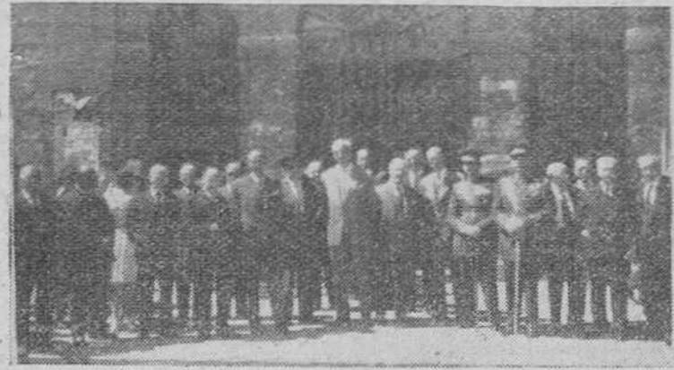
Dos documentos gráficos de los actos celebrados ayer en Burgos, con motivo de la festividad de Santiago Apóstol. En la parte superior, un momento de la misa de campaña, celebrada en el cuartel del Regimiento de Caballería y en segundo plano, grupo de concurrentes a la ceremonia conmemorativa que organizó el Cuerpo de Telecomunicaciones.