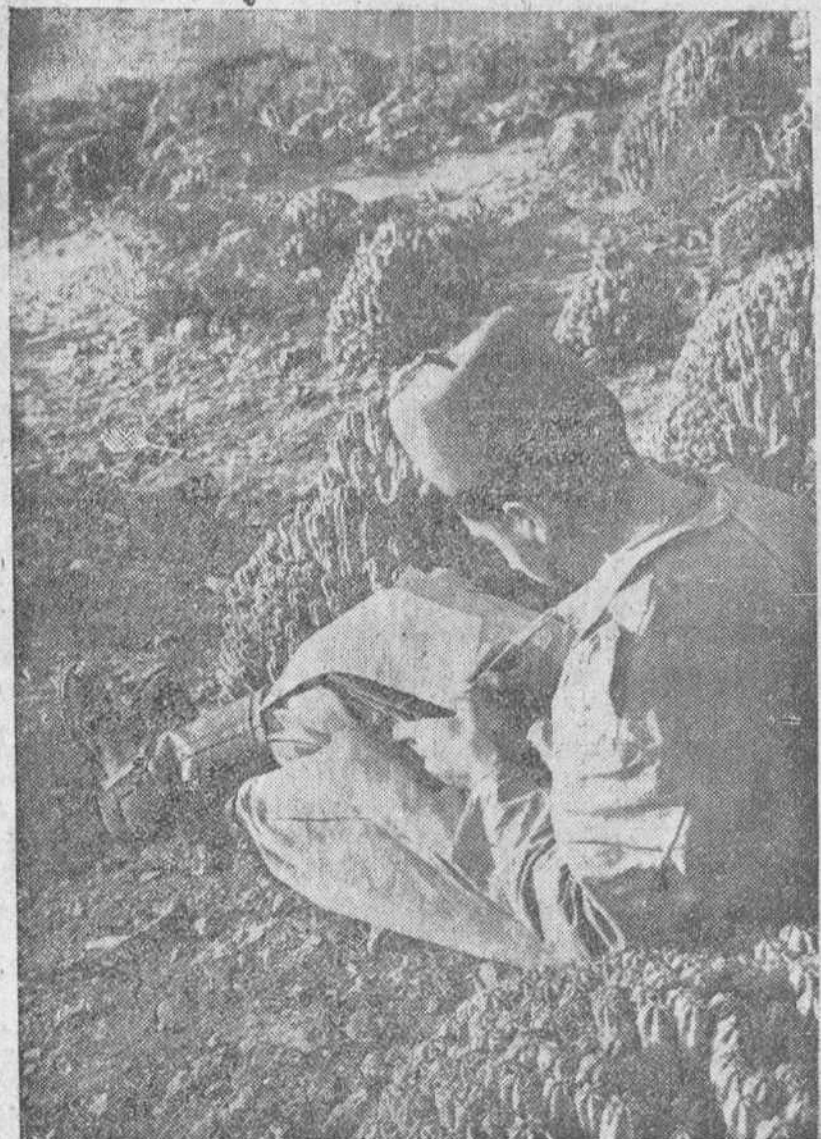
Actualidad en Sidi Yni

Nuevos incidentes en Chipre y cinco turco-chipriotas muertos