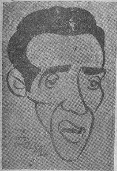
El francés Grazyk, vencedor ayer en Santander

No se han producido modificaciones en la general donde sigue primero el francés Stablinsky