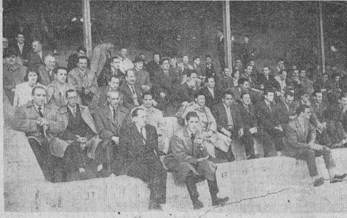
Una numerosa "hinchada" se trasladó a Valladolid para presenciar el partido que el Burgos jugó contra el Júpiter el domingo. En la precedente plaza se aprecian muchas caras conocidas en la tribuna del Estadio de Zorrilla.—(Foto Santiago).

Partido de muchos nervios y fuerte oposición vallisoletana. Primera parte de inoperancia ofensiva y una media hora (de la segunda) floja.— Al final, terminó en plan de rotundo vencedor. Hasta el minuto 33 del segundo tiempo se perdía por 2-1