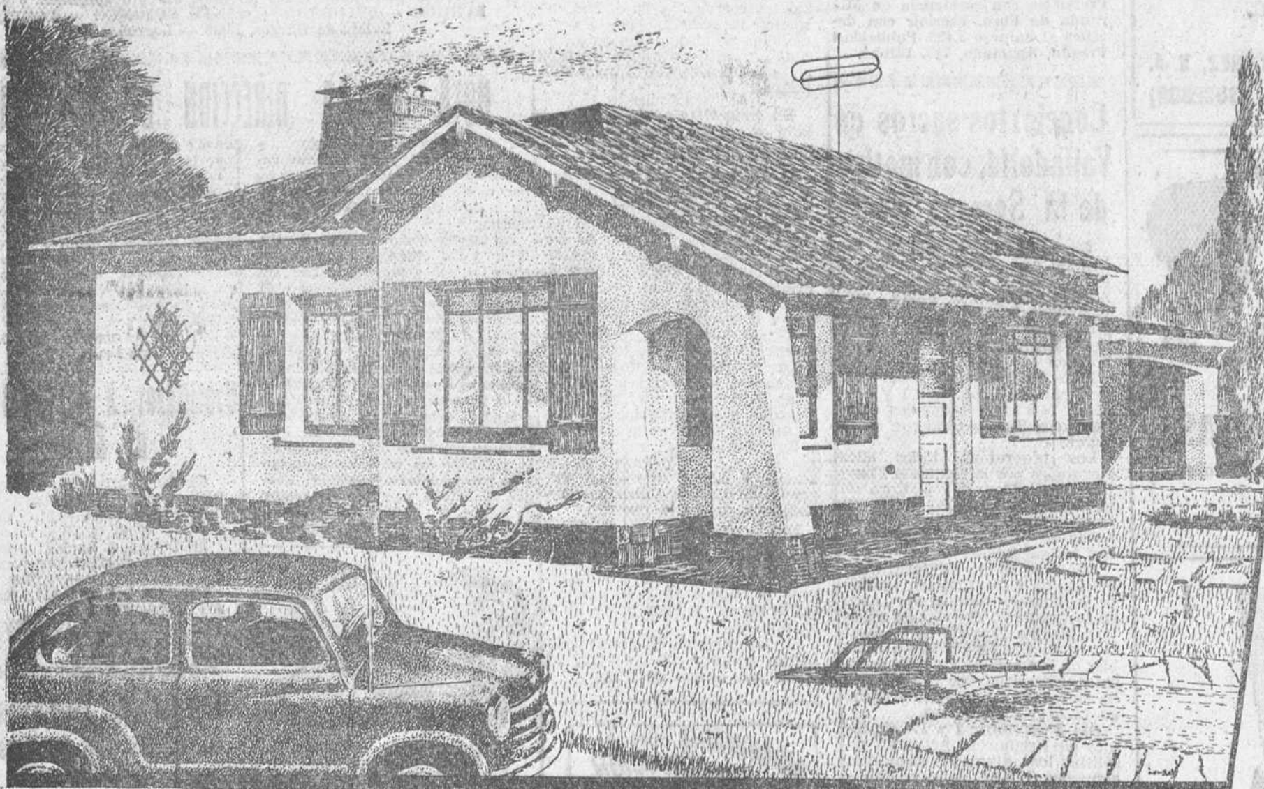
Proyecto del chalet que se regala: Recibidor, comedor, living, 2 dormitorios, cuarto de baño completo, aseo, cocina, garage, etc... Se construirá en el lugar elegido por el afortunado, dentro de las bases del sorteo.