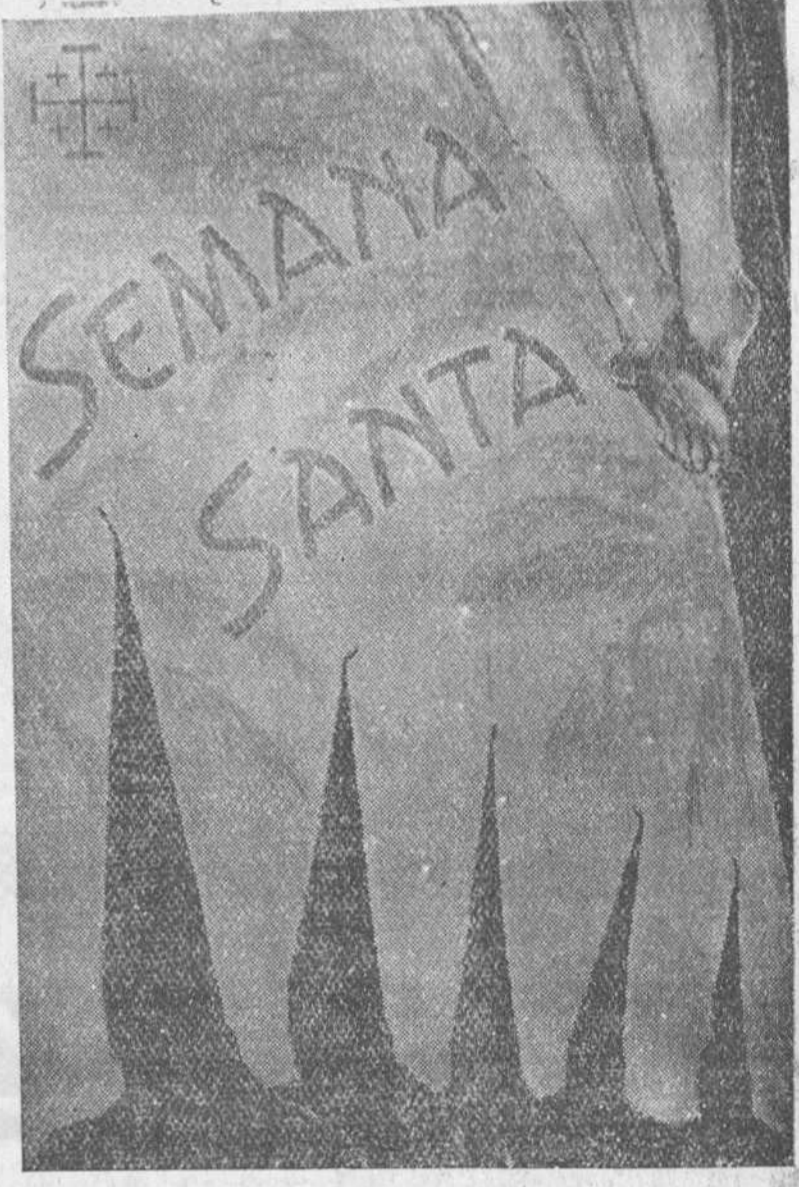
Santa Isabel de Fernando Poo. — Cartel anunciador de la Semana Santa que se celebrará en esta capital de la Guinea Española.