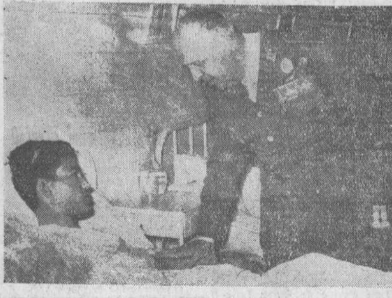
Las Palmas. — Con motivo de su estancia en esta capital, el teniente general Barroso visitó el Hospital Militar y conversó con algunos heridos en el Africa Occidental Española.