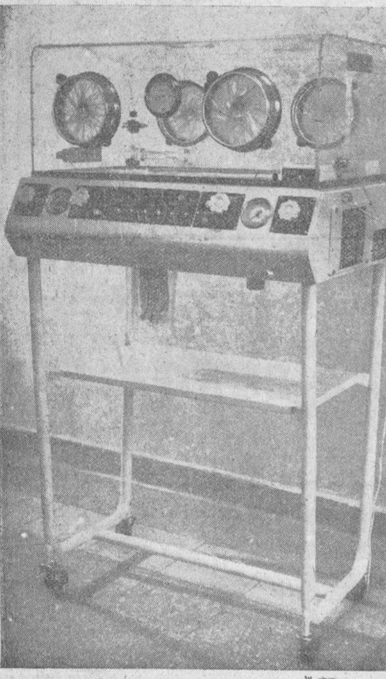
Moderna incubadora modelo "Oxifar, I-6", dotada de completísimo mecanismo de precisión, que ha sido adquirida para completar el equipo de la Sección de Maternidad de la Clínica de San Juan de Dios, de esta capital.