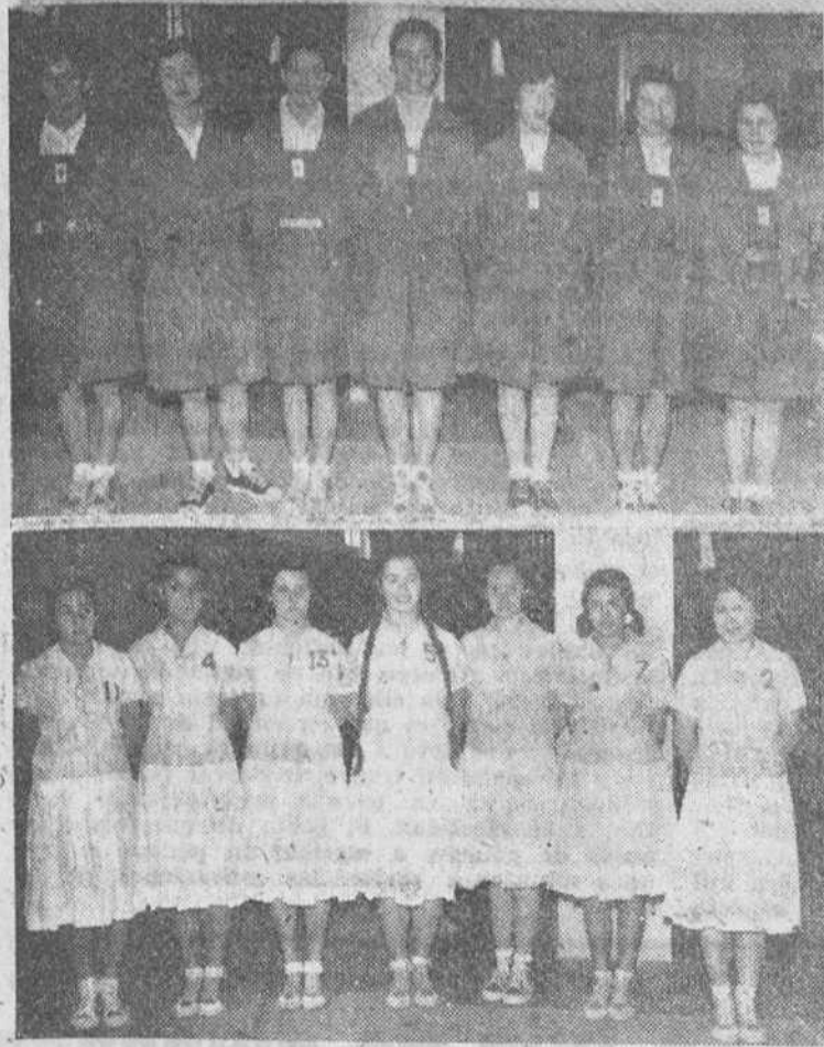
El domingo finalizaron las fases regionales de baloncesto de la Sección Femenina, que han venido celebrándose en el frontón cubierto de la Ciudad Deportiva.

En los partidos finales contendieron, en la categoría de juveniles, las Esclavas, de Santander y Asunelón, de Guipúzcoa y en mayores, Vizcaya y Guipúzcoa. En ambos casos la victoria sonrió a las guipuzcoanas, que aparecen en los grabados. Arriba, las componentes del conjunto de la Sección Femenina y abajo, las de menores.