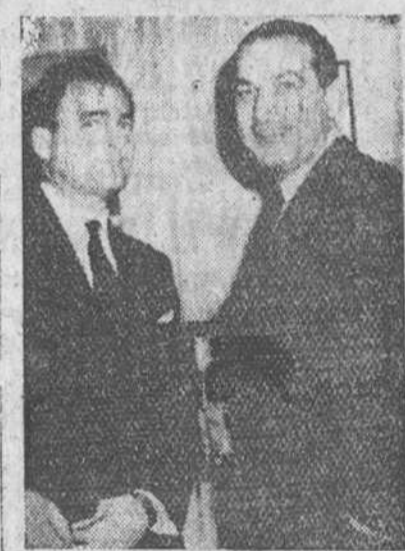
San Francisco.—El productor cinematográfico Mike Todd (a la izquierda) y el escritor de asuntos cinematográficos Cohn, que resultaron muertos al estrellarse el avión particular de Todd cerca de Grants. Esta fotografía fue obtenida en Enero de 1957, en el club de Prensa de esta ciudad.—(Foto Cifra)