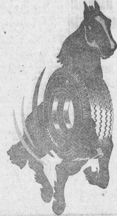
zeus GRAN CARGA

para rutas irregulares y velocidades normales