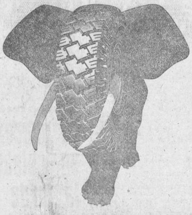
atlante GRAN CARGA

para rutas irregulares y velocidades normales