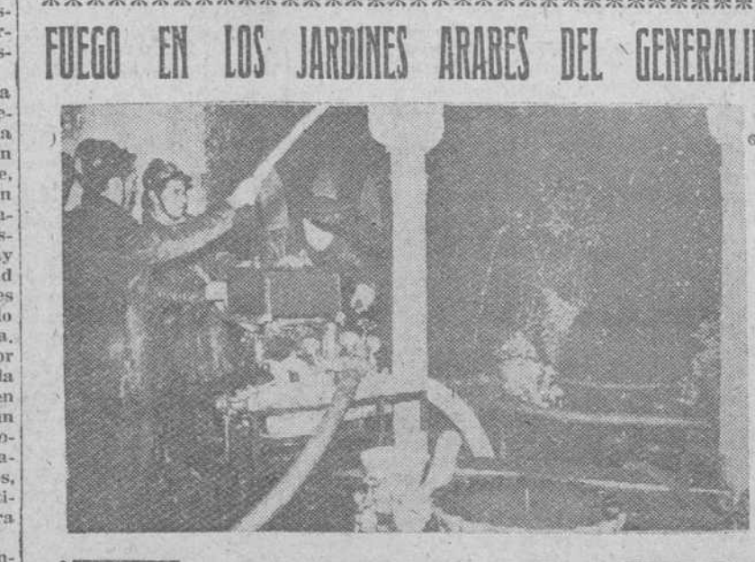
Granada. — Los bomberos trabajando en la extinción del fuego declarado en una de las naves, destinada a almacén de herramientas, del patio de la acequia del Generalife. Gracias al agua de sus surtidores y a la que discurre por el sistema de acequias construida en tiempos de los moros, pudo sofocarse el fuego que estuvo a punto de destruir el palacio árabe del Generalife, lleno de verdor y poético encanto. — (Foto Cifra)

FUEGO EN LOS JARDINES ARABES DEL GENERALIFE Granada. — Los bomberos trabajando en la extinción del fuego declarado en una de las naves, destinada a almacén de herramientas, del patio de la acequia del Generalife. Gracias al agua de sus surtidores y a la que discurre por el sistema de acequias construida en tiempos de los moros, pudo sofocarse el fuego que estuvo a punto de destruir el palacio árabe del Generalife, lleno de verdor y poético encanto. — (Foto Cifra)