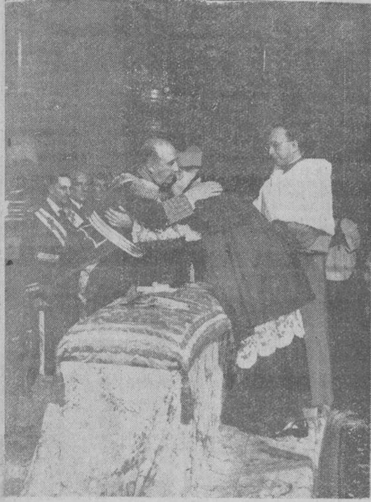
Madrid. — Después del solemne acto de la imposición de la birreta cardenalicia al Arzobispo de Sevilla, Cardenal Bueno Monreal, S. E. el Jefe del Estado abraza al nuevo purpurado, de acuerdo con el ceremonial que se celebró en la capilla del Palacio Real y con asistencia de la esposa del Caudillo, los ministros del Gobierno, Consejo del Reino y otras personalidades.

El Jefe del Estado impuso la birreta cardenalicia al Arzobispo de Sevilla