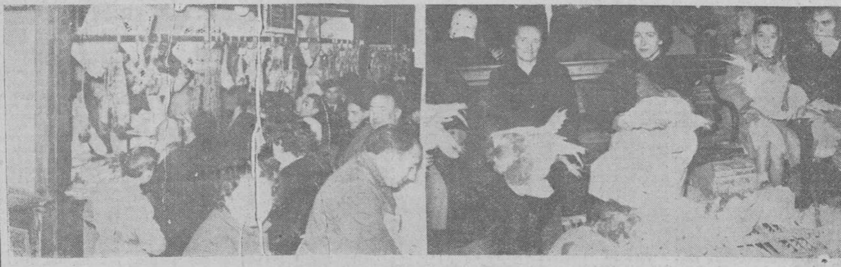
Los aspectos del mercado de abastos de la zona Norte, en la última jornada de las vísperas navideñas. A la izquierda, el público agolpado ante una de las carnicerías. A la derecha, aldeanas y granjeras exhibiendo sus aves, que vendieron a buenos precios, en el interior del recinto.