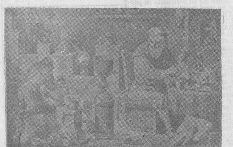
Reproducimos el cuadro de David Tenier, pintor flamenco del siglo XVII, titulado "El Elixir de la larga vida", en el que vemos trabajar a un alquimista y su mancebo.

Castilla, por Montalvo, la cual manda que ningún judío ni judía, ni moro, ni mora, sean especieros, ni boticarios, ni cirujanos, ni vendan a cristianos cosa de comer, ni tengan botica, etc., bajo la pena de dos mil maravedis, a más de la corporal que a nuestra merced plugiere; y la ley 18 del mismo tit y libro, que los judíos y moros no visiten a cristianos ni les den medicinas y al que lo hiciera peche por cada vezada trescientos maravedis.