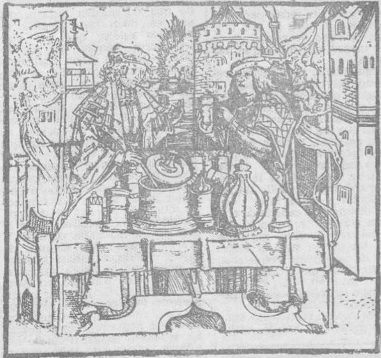
Vendedor de triaca, en Estrasburgo, a comienzos del siglo XVI grabado al boj del "Liber de Arte distillandi", de Jerónimo Brunschwig, impreso en Estrasburgo el año 1512.