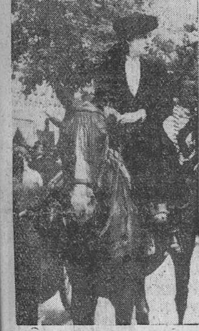
Sevilla. — La Marquesa de Villaverde recorriendo el real de la Feria a caballo.