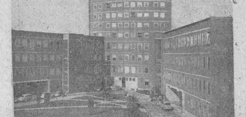
Tras la clausura del XIV Pleno del Consejo Superior de Investigaciones Científicas, serán inauguradas hoy en Madrid las instalaciones del Centro de Investigaciones Biológicas...