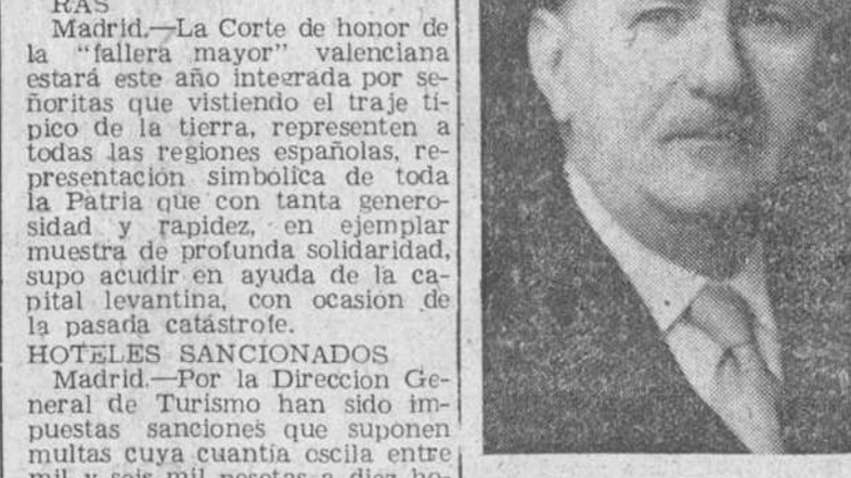
Madrid. — El ilustre periodista don Manuel Aznar que ha sido nombrado director de la Agencia "Efe".