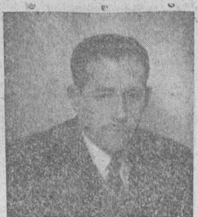
Aranda de Duero. (De nuestro corresponsal). — Según noticias recibidas del Gobierno Civil de la provincia, ha sido nombrado alcalde de esta villa...

Asistirán el presidente de la Diputación y otras jerarquías provinciales