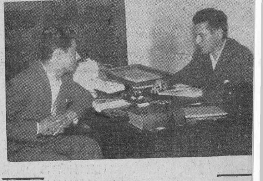
El maestro Rafael Frühbeck, conversando con nuestro redactor, en el curso de la entrevista mantenida con el joven músico burgalés

Rebosante de simpatía, correctísimo en su expresión, el maestro Frühbeck va respondiendo con claridad a mis preguntas.