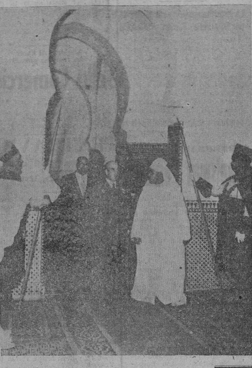
Tetuán. — S. A. I. el Jalifa del Marruecos español, Muley el Hassan Ben el Mchdi, acompañado al Alto Comisario, teniente general García Valiño, después de asistir al te ofrecido por S. A. I. en su residencia del Palacio del Mexuar, a las autoridades, para celebrar el XXX aniversario de su exaltación al Jalifato.