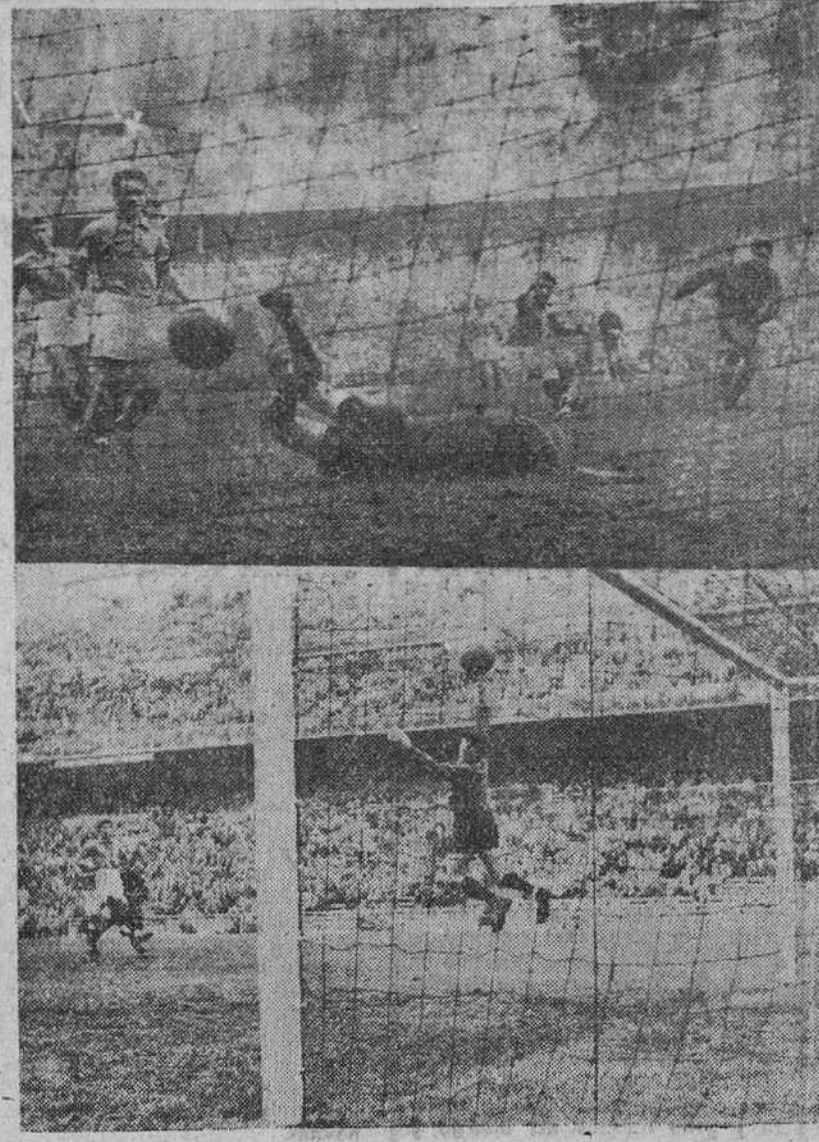
Segundo y tercer goles españoles, logrados por Agustín y Collar, respectivamente.