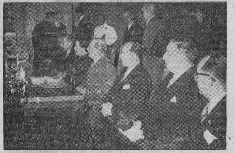
Madrid.— Un momento de la solemne sesión de clausura del I Congreso Iberoamericano de Municipios, presidida por Su Excelencia el Jefe del Estado español.