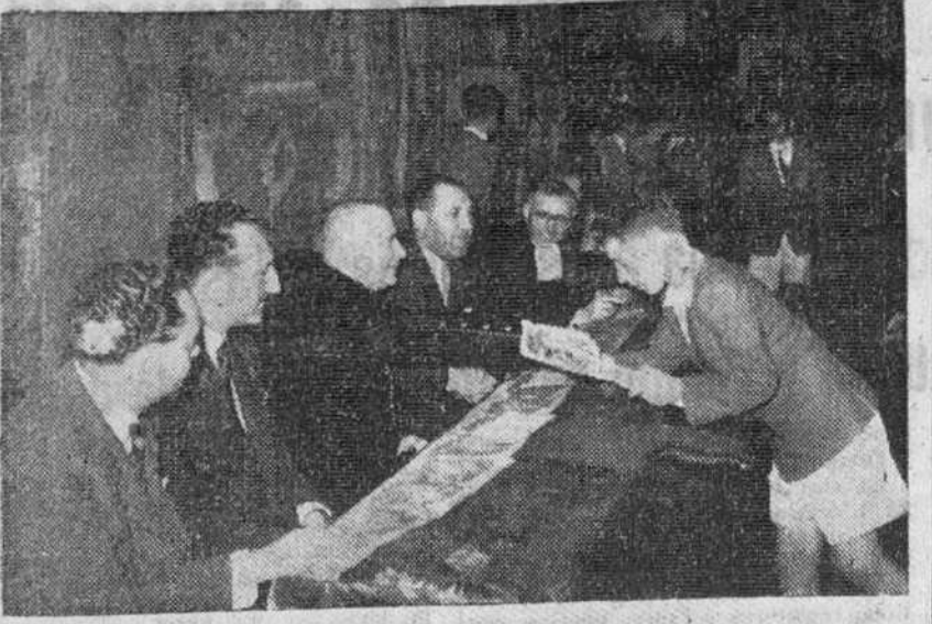
El Ilmo. Sr. Vicario general del Arzobispado, entregando el premio, a uno de los alumnos galardonados, en la fiesta celebrada por el Colegio "La Salle".

El domingo a las once y media según un establa anunciado en el programa, tuvo lugar en el Teatro Avenida la solemne distribución de premios a los alumnos del Colegio La Salle, que por su esfuerzo y constante aplicación a lo largo del curso que termina, se han hecho acreedores a algunas de las recompensas establecidas.