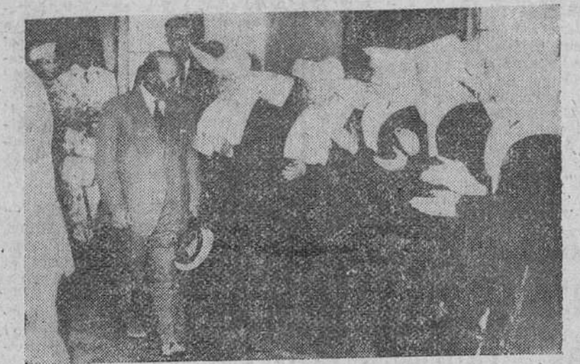
San Sebastián. — S. E. el Jefe del Estado, Generalísimo Franco, acompañado de su esposa, doña Carmen Polo, a su llegada a la casa fundación "Goyeneche" para proceder a la inauguración de la colonia infantil.

Bermeo. — A las dos de la tarde comenzaron a hacerse a la mar las embarcaciones de la flota pesquera de Bermeo, que navegaban en sentido paralelo a la costa, para escoltar al yate "Azor", en el que Su Excelencia el Jefe del Estado se dirigía a Bermeo. Los barcos, profusamente engalanados y tocando las sirenas, sumaban unos 250, con más de diez mil personas a bordo.