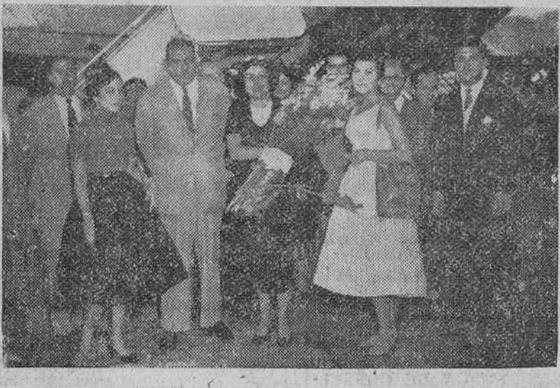
Aeropuerto de Barajas. — El gobernador del Estado Libre Asociado de Puerto Rico, don Luis Muñoz Marín, con su esposa e hijas y personalidades de su séquito, a su llegada a Madrid.

París. — El primer ministro Edgar Faure, ha anunciado esta mañana, a primera hora, después de tres reuniones, que el Gobierno francés ha aceptado su plan para resolver la cuestión del Norte de África. El Gabinete ha aceptado "mi plan", se limitó a decir Faure. Sin embargo, en fuentes autorizadas se dice que el acuerdo está aún lejos de ser completo, especialmente en la cuestión del regreso del Sultán exiliado, Sidi Mohamed Ben Yusef.—Efe.