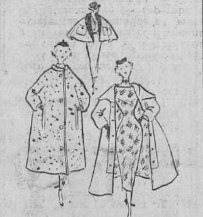
Y las mantiques... Y por este amor intenso que el maestro sentía por todo lo que era bello, optimista y elegante, su nombre continúa brillando entre los astros del cielo de la moda, que viene a ser este cielo irisado, luminoso y cambiante, de Paris.