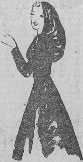
Abrigo de lana almohadada con capuchón. — (Creación Hubert de Givenchy, diseño inédito de José de Zamora)

prepara la próxima colección. Una colección postuma, cosa inédita en los anales de la alta costura. Hecha con todos los diseños que, hasta sus últimos días trazó la mano del gran creador de elegancias. Y naturalmente, se espera con gran curiosidad, mezclada de melancolía, la presentación de esta colección que nos dirá si verdaderamente, el espíritu de Fath sobrevive en el de su viuda, la encantadora Geneviève. Porque ha sido Geneviève la que ha recogido el mando de la casa, con un valor extraordinario, dado que nunca se ocupó realmente de otra cosa, que de lucir con gracia inimitable las creaciones que amorosamente hacía Fath para ella, que fue siempre su maniquí ideal.