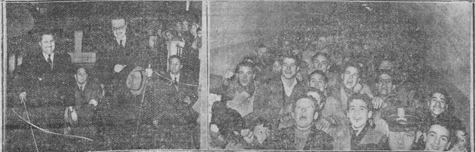
¡Por fin! He aquí el grito alborozado que lanzaron ayer los vecinos de la zona de Santa Dorotea, al ver inaugurado oficialmente, en acto solemne presidido por las autoridades, el paso subterráneo bajo las vías del ferrocarril, en el mismo lugar donde una larga lista de muertes, acaecidas en el transcurso de decenas de años, había hecho archifamoso el fatídico "paso a nivel". En las fotos de "Fede" que reproducimos, aparece el alcalde cortando la cinta simbólica, acompañado del gobernador civil y otras personalidades y a la derecha, el júbilo de la juventud del barrio, al atravesar por vez primera el túnel que comunica ambos lados de la calle. — (Información en cuarta página)