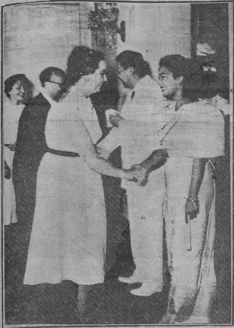
Manila. — Los embajadores de España en Manila felicitan a la señora de Magsaysay y a S. E. el presidente de la República, con ocasión del día 1.º de año.