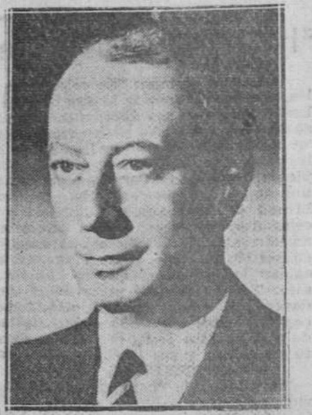
Mr. Pierre Schneider, del M. R. P. que ha sido elegido presidente de la Asamblea Nacional francesa, por 232 votos contra 188.

tud. ¡Yo no sé cómo podían escribir tanto aquellas novias! La idea de la muerte próxima estaba cada vez más en su conversación. La última vez que hablé con él fue cuando habían comenzado los preparativos para el homenaje nacional que se le iba a rendir y cuyo proyecto quedaba roto por el fallecimiento del insigne escritor. Me dijo aquellas cosas que conigo estaban: —Esta vez no he podido evitar el homenaje. Cuando me enteré del propósito, ya éste se hallaba en marcha. Y no sé, pero me parece que esto va a ser algo así como rendir honores a un muerto. Tratamos de alejar de él esas preocupaciones, mas nos atajó enseguida el diapasón confidencial de su voz enferma: —No. Si yo a la muerte no la temo. Hace muchos años que la aguardo. Lo que ocurre es que tengo bastante labor entre manos y quisiera verla terminada.