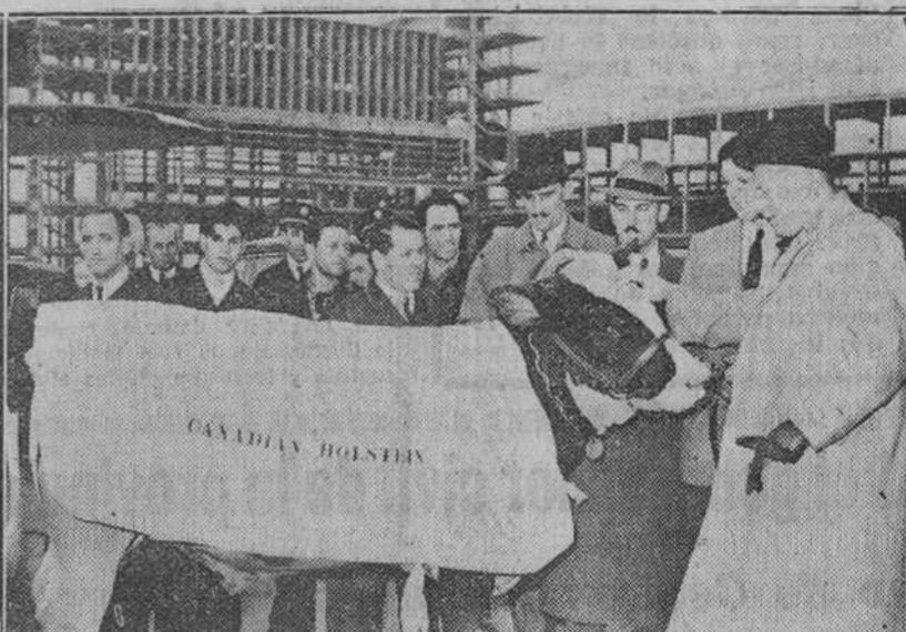
Madrid. — La fotografía recoge un momento del desembarque de ocho escogidos toros entre las reses más productoras de las vacadas holandesas Holstein-Friesian, del Canadá, llegados a Barajas por vía aérea, con el fin de mejorar las razas bovinas españolas. Estuvieron presentes en el acto, el director general de Ganadería, embajador del Canadá y otras personalidades.

Llegada de toros canadienses para mejorar las razas bovinas españolas