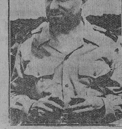
El general Ely, comisario general de Francia en Indochina, ha sido llamado a París y lo sustituirá en el mando militar el general Pierre Jaquet, que aparece en la fotografía.