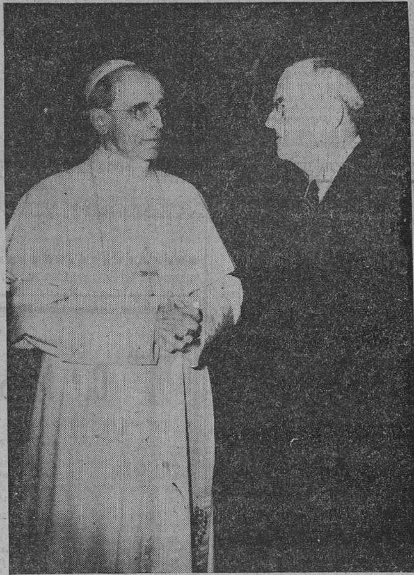
Roma. — S. S. Pio XII acompañado de Mr. Foster Dulles, secretario de Estado norteamericano, durante la audiencia especial celebrada en Castelgandolfo.