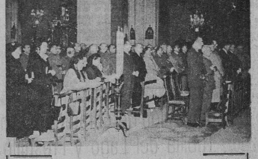
Al cumplirse el tercer aniversario del fallecimiento del insigne soldado y ejemplar patriota don Juan Yagüe Blanco (q. e. p. d.), le han sido dedicados expresivos homenajes de recuerdo y cariño. En nuestro grabado aparece, en primer término, el Consejo provincial del Movimiento ante la tumba del lorado general, en el momento de la imposición de la corona ofrendada por dicho organismo. Al pie, presidencia del solemne funeral celebrado, a mediodía de ayer, en la iglesia de San Lorenzo.