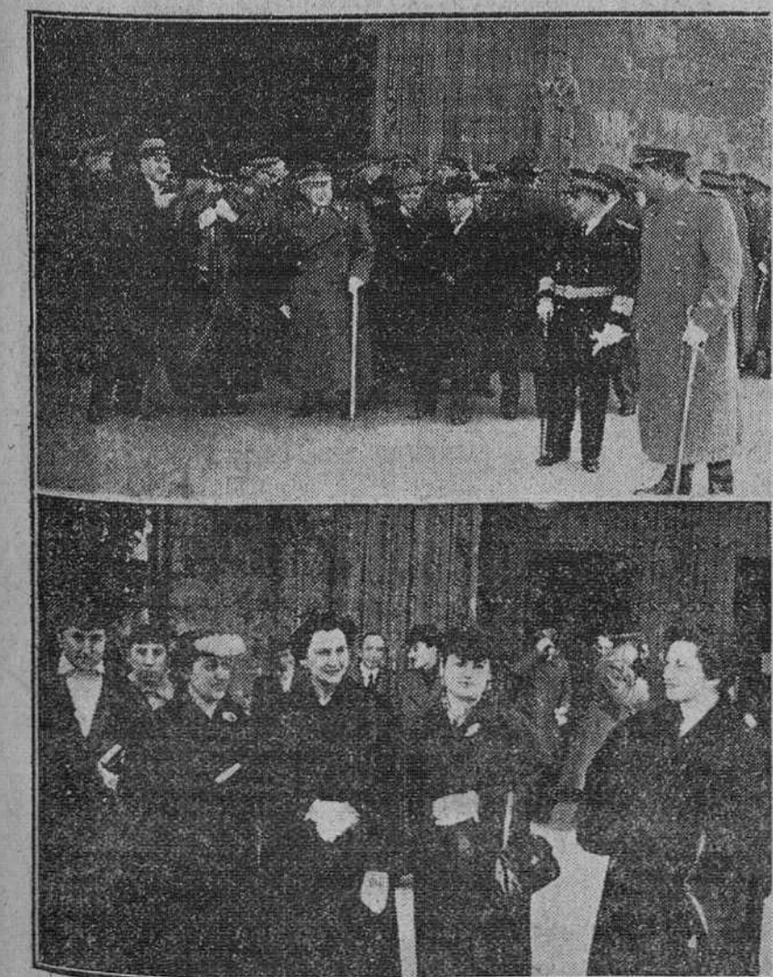
En la parte superior, las primeras autoridades burgalesas, que asistieron en la mañana de ayer a la misa celebrada en la iglesia de la Merced, con motivo de la festividad del Santo Ángel de la Guarda, Patrono de los Cuerpos de Policía. En la parte inferior, la señora del gobernador civil a la salida de dicha ceremonia acompañada por otras distinguidas damas y señoritas.