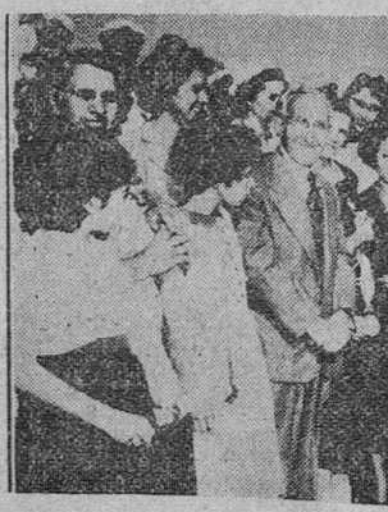
La Habana. — Grupo de españoles que integran la nueva expedición del plan "Romería Española", a bordo del vapor "Monte Ulía", momentos antes de salir con dirección a España. Fueron despedidos, en nombre del embajador, por el agregado de Prensa y jefe de Información. — (Foto Cifra)