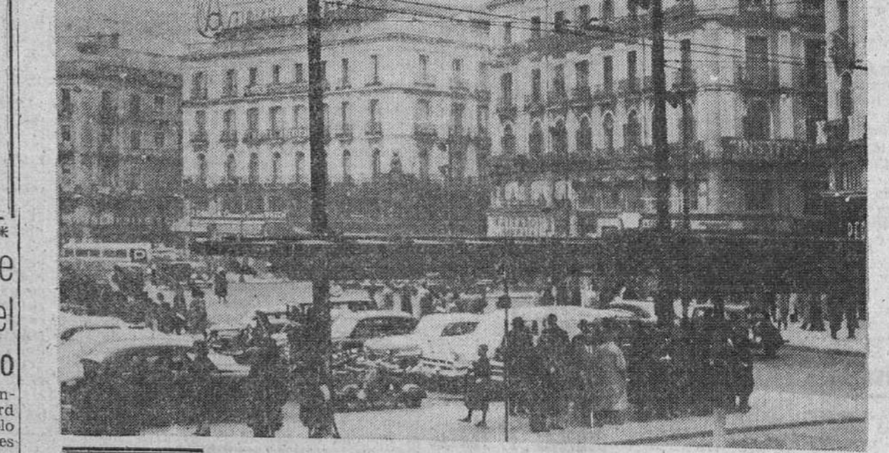
Madrid. — En la Puerta del Sol se han instalado en una noche los aparatos calefactores por rayos infrarrojos para hacer menos cruda la espera bajo las marquillas de las paradas de las líneas de transporte urbano.