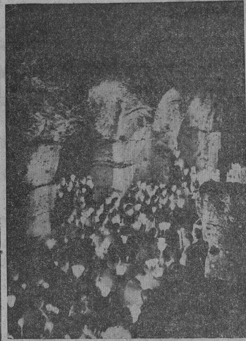
Roma. — Mil quinientos católicos austriacos llegados en peregrinación a esta capital, en acción de gracias por la recuperación de la independencia de su país, rezan en las antiguas catacumbas bajo el antiguo coliseo romano y alumbrándose con antorchas.

Madrid. — El ministro de la Gobernación, señor Pérez González, regresó de su viaje a Venezuela y La Habana, a mediodía del domingo, por vía aérea, acompañado de su esposa.