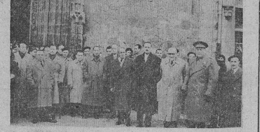
A la salida de la iglesia de los PP. Jesuitas, el alcalde de la ciudad, representantes y directivos de la Peña Guitarrista Burgense, posan para nuestro periódico, después de asistir el domingo a la misa organizada con motivo del V aniversario fundacional de aquella sociedad.