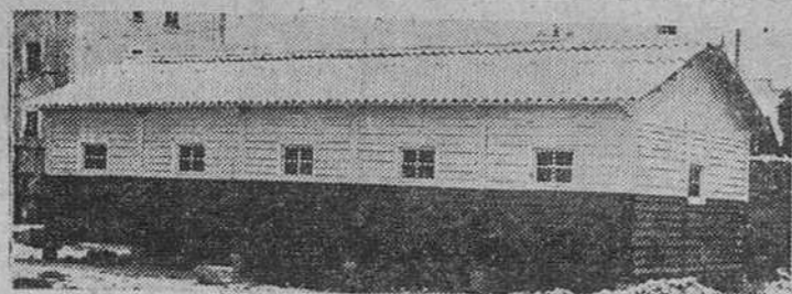
CASAS PREFABRICADAS. — De madera, desmontables. Solicite proyectos y presupuestos a CALVO E HIJOS. — MADERAS INDUSTRIALES San Pedro y San Felices, 43. — Teléfono, 3555. — Burgos

Necesitamos adquirir terreno lindante carretera general Madrid-San Sebastián. Extensión no menor 5.000 metros cuadrados. Escriban con precios, detalles y planos a PROMOTION Publicidad, José Antonio, 57. — MADRID