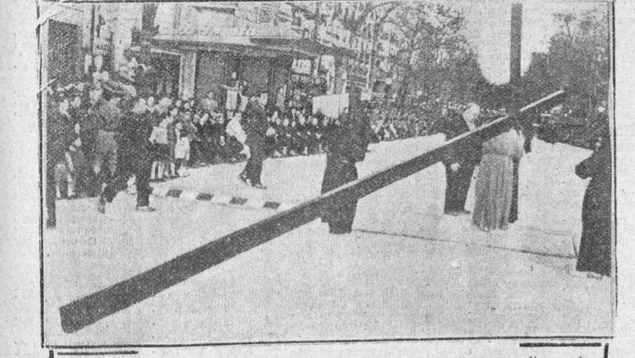
Un penitente barcelonés ha llevado a cuestas, durante las tres horas y media que duró la procesión de la Buena Muerte, una cruz cuyo peso era de 90 kilos y de unos 8 metros de largo. Iba descalzo, encadenadas las manos a la cruz y llevaba una corona de espinas verdaderas en la cabeza.