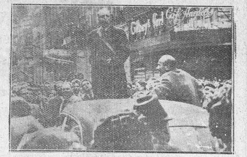
Para protestar de la política escolar del Gobierno, millares de católicos belgas se han manifestado en las calles de la capital, habiéndose producido muchos incidentes. Un diputado católico arenga a los manifestantes.