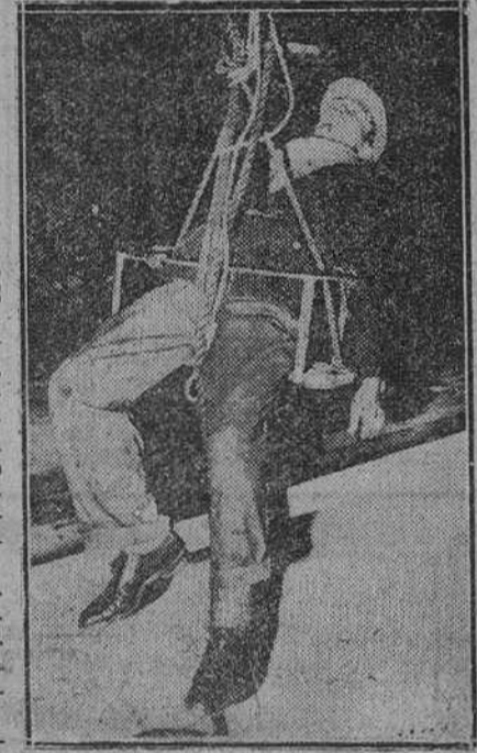
En Londres se han verificado las pruebas de esta silla de seguridad para trabajadores a gran altura, que evita los riesgos de una caída, permitiendo a la vez mayor libertad de movimientos que los actuales cinturones.