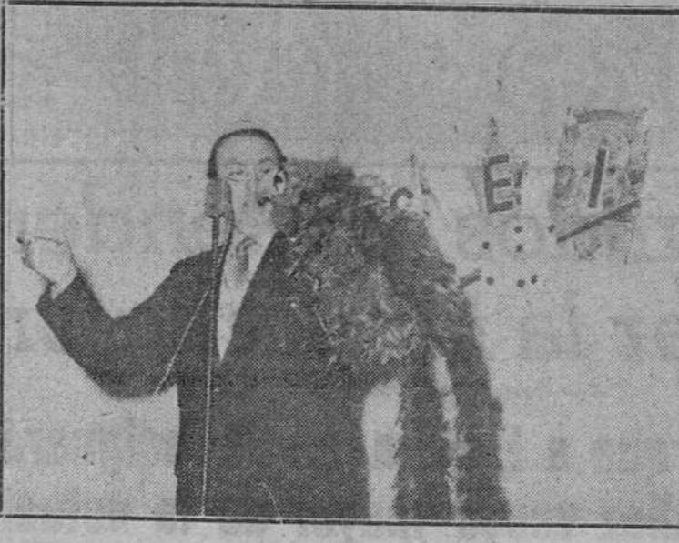
Madrid.— La Sociedad Española de Ilusionismo celebró una "comida de hermandad mágica" en un popular restaurante, durante la cual los "magos" sirvieron los platos a los comensales y la sobremesa se prolongó entre trucos y ejercicios durante varias horas. La foto muestra un momento del simpático acto.