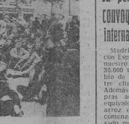
Madrid. — Los huelguistas del Metro y los autobuses parisinos sentados en la calzada del boulevard Saint-Germain, frente al Ministerio de Transportes, interrumpen la circulación rodada.