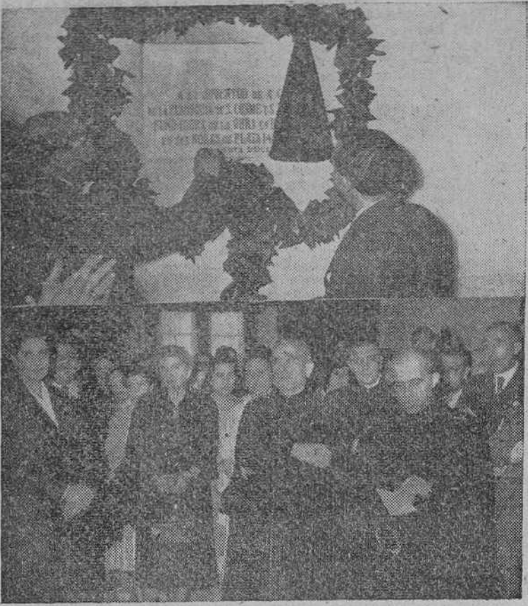
Con gran solemnidad se celebró el domingo la conmemoración del XXV aniversario de la fundación de la Juventud de Acción Católica. Las precedentes fotografías recogen: en primer término, el momento en que se descubrió la lápida colocada al efecto en la parroquia de San Cosme; después, un grupo de concurrentes a dicha ceremonia.

Paternal mensaje del Excmo. Sr. Arzobispo en tan brillante jornada