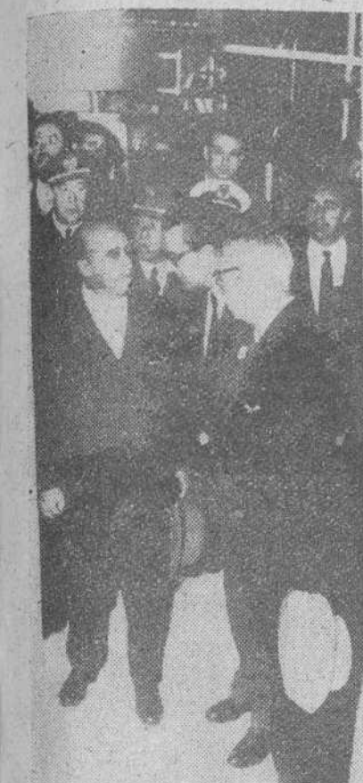
Badalona. — S. E. el Jefe del Estado durante su visita a la central térmica de Badalona con motivo de la inauguración del primer grupo turbogenerador de la misma.

El Caudillo inaugura el primer grupo de una central térmica