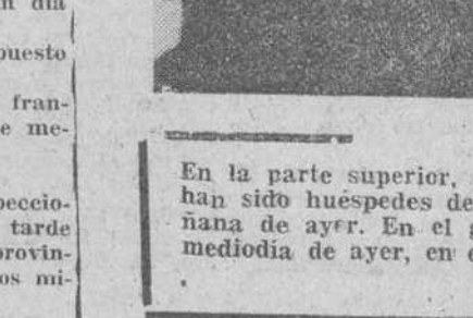
En la parte superior, el grupo de directores de Agencias de Viaje norteamericanas que han sido huéspedes de nuestra ciudad, después de su visita a la S. I. Catedral en la mañana de ayer. En el grabado inferior, un momento de la solemne recepción celebrada a mediodía de ayer, en el Ayuntamiento, en honor de los visitantes norteamericanos.