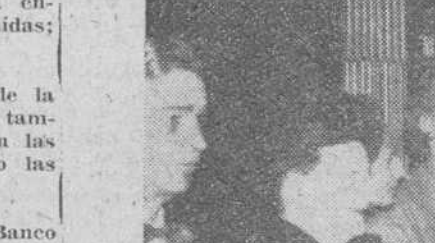
En la parte superior, el grupo de directores de Agencias de Viaje norteamericanas que han sido huéspedes de nuestra ciudad, después de su visita a la S. I. Catedral en la mañana de ayer. En el grabado inferior, un momento de la solemne recepción celebrada a mediodía de ayer, en el Ayuntamiento, en honor de los visitantes norteamericanos.