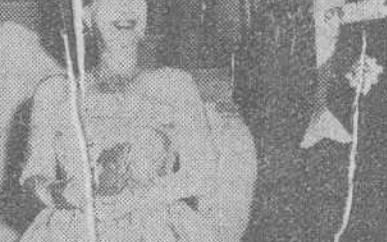
En la parte superior, el grupo de directores de Agencias de Viaje norteamericanas que han sido huéspedes de nuestra ciudad, después de su visita a la S. I. Catedral en la mañana de ayer. En el grabado inferior, un momento de la solemne recepción celebrada a mediodía de ayer, en el Ayuntamiento, en honor de los visitantes norteamericanos.