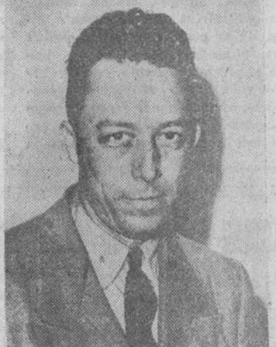
Paris. — Albert Camus, autor francés, galardonado con el Premio Nobel de Literatura.