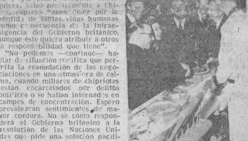
La Reina Isabel de Inglaterra, el Príncipe Felipe y sus acompañantes, rien todos al presenciar una demostración con un mondador de patatas, en la exposición del "Hogar Ideal" que organiza el periódico londinense "Daily Mail".

Créese que existe una capa de veinte kilómetros por cuatro que podría almacenar gran abundancia de "oro líquido"