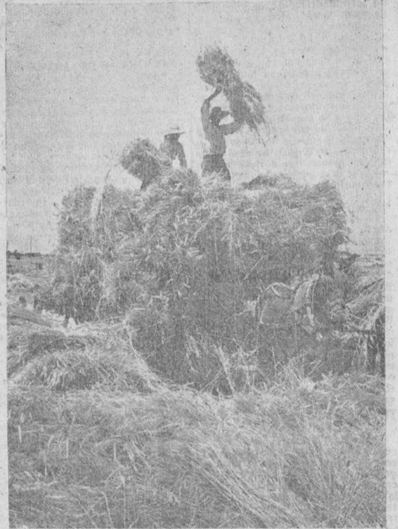
Las labores agrícolas exigen actualmente en el agro español el empleo de gran número de brazos campesinos, como se aprecia en la "foto". La mecanización del campo simplificará grandemente estas labores.