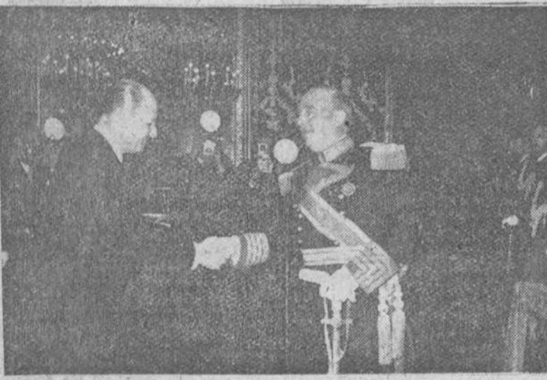
Madrid. — S. E. el Jefe del Estado, durante la audiencia concedida al Ayuntamiento de esta capital en corporación, presidida por su alcalde, Sr. Cande de Mayalde, con motivo del XVIII aniversario de la Liberación de Madrid por las tropas nacionales.