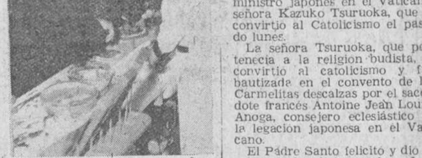
La Reina Isabel de Inglaterra, el Príncipe Felipe y sus acompañantes, rien todos al presenciar una demostración con un mondador de patatas, en la exposición del "Hogar Ideal" que organiza el periódico londinense "Daily Mail".