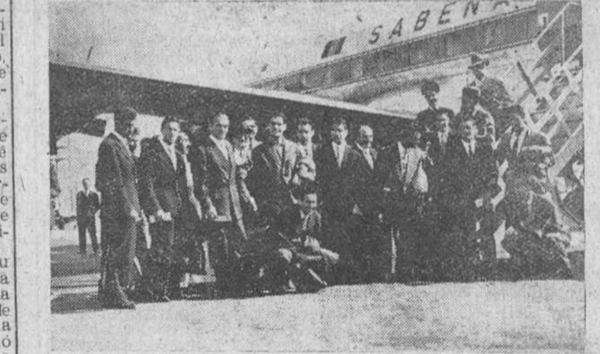
Aeropuerto de Barajas. — Los componentes del equipo nacional español de fútbol, junto al avión en que hicieron el viaje a Bruselas, donde jugarán mañana domingo contra la selección nacional belga.