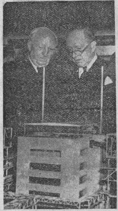
Lord Woolton y lord Salisbury contemplan una maqueta del famoso establecimiento atómico de Calder Hall, en la exposición de "Atomos y Salud" inaugurada recientemente en Londres.

Londres. — Radio Moscú, en su emisión de habla inglesa, dice que «Norteamérica se encuentra por detrás de la Unión Soviética en la producción de armas atómicas y de proyectiles dirigidos de largo alcance». La emisora comunista añade que los informes aparecidos en el periódico «New York Herald Tribune», según los cuales Estados Unidos habían conseguido una superioridad militar, son falsos.