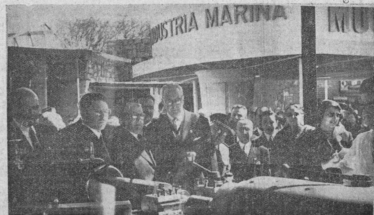
Madrid. — Los ministros de Industria, Trabajo y Secretario General del Movimiento, visitando la Exposición Nacional Siderometalúrgica, en el acto inaugural.