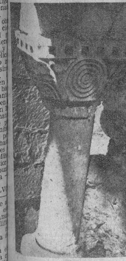
Detalle de uno de los capitales románicos tallados y como aparece descubiertos en la torre del Cid, de San Pedro de Cardeña.

Próximamente lo será el claustro regular