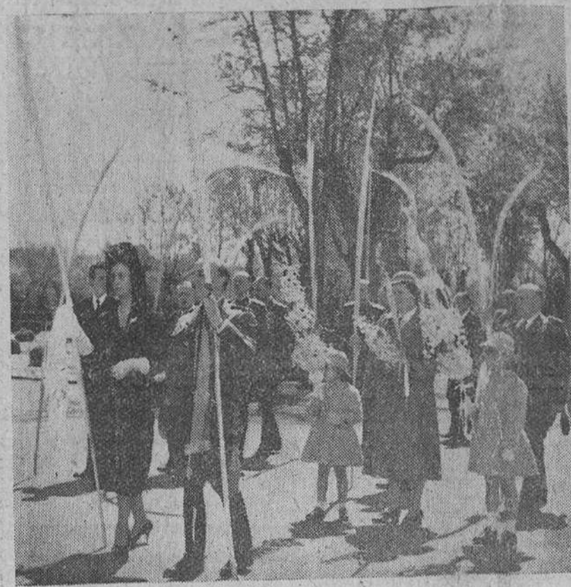
El Pardo.—Su Excelencia el Jefe del Estado, con su esposa y nietas, durante la procesión de las Palmas celebrada en El Pardo, con motivo de la festividad del Domingo de Ramos.