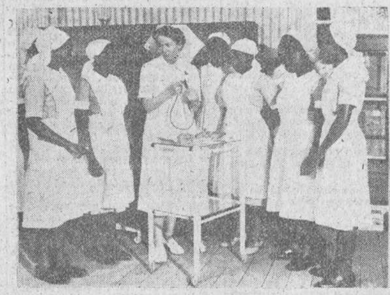
Grupo de enfermeras kikuyás escuchando las explicaciones de una profesora británica.

Un nuevo país, que camina hacia el progreso a pasos agigantados, sustituye al de los sanguinarios "Mau Mau"