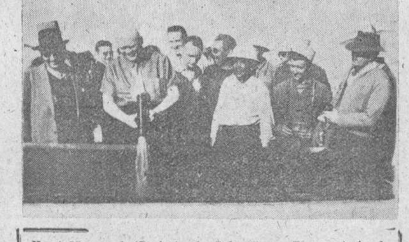
Hassi Messaud (Desierto de Sahara). — El secretario de Trabajos Públicos francés, Maurice Lamaire (centro) llevando un tanque de petróleo procedente de una de las perforaciones realizadas en esta región del desierto de Sahara, que ahora se ha revelado como fuente de una gran riqueza de "oro negro".