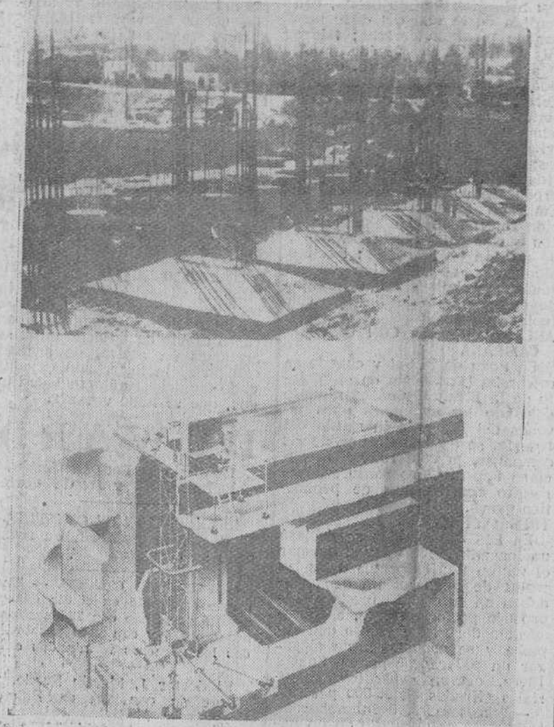
Madrid.— En la parte superior, vista de las obras que se realizan en los Muelles para la instalación de un reactor atómico del tipo «piscina», de acuerdo con el convenio hispano-norteamericano sobre la energía atómica y el adiestramiento de técnicos españoles. En la inferior, sección vertical del reactor de 3.000 kilovatios de capacidad térmica que serán instalados en dicho lugar.