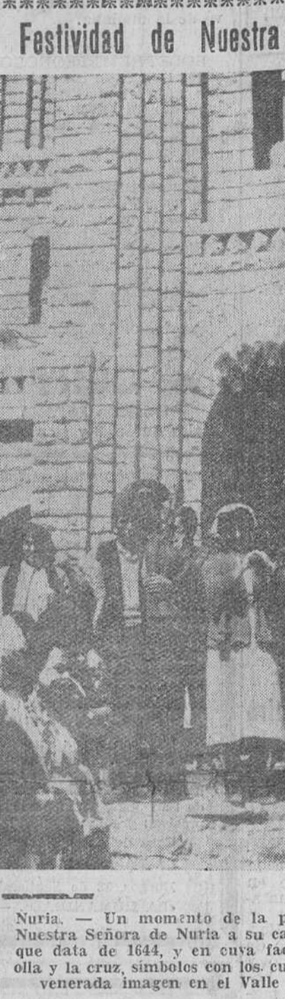
Nuria. — Un momento de la procesión de la imagen de Nuestra Señora de Nuria a su capilla primitiva de San Gil, que data de 1644, y en cuya fachada figura la campana, olla y la cruz, símbolos con los cuales hizo su aparición esta venerada imagen en el Valle de Nuria.