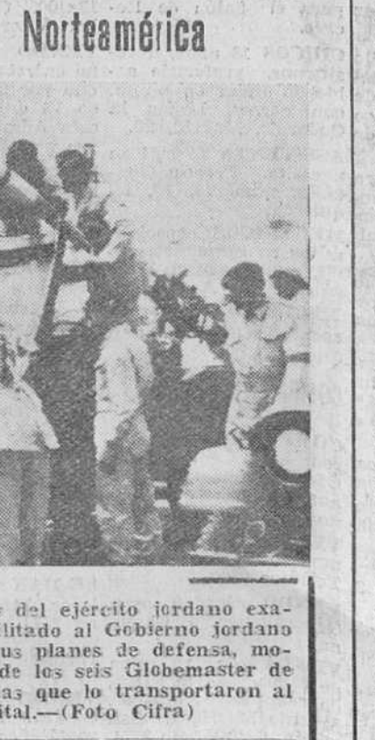
Amman. — Oficiales y miembros del ejército jordano examinan el material de guerra facilitado al Gobierno jordano por los Estados Unidos y para sus planes de defensa, momentos después de su descarga de los seis Globemaster de las fuerzas aéreas norteamericanas que lo transportaron al aeropuerto de esta capital.