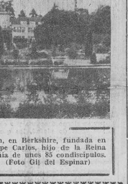
Una vista de la Escuela Cheam, en Berkshire, fundada en 1640, donde estudiará el príncipe Carlos, hijo de la Reina Isabel de Inglaterra, en compañía de unos 85 condiscípulos.

Austria en relación con los acontecimientos húngaros del pasado otoño. "Nunca mereció más un pueblo el premio Nobel de la paz", añadió. Declaró que Cuba votará a favor de la moción presentada ante la Asamblea por 37 potencias pero añadió: "Creemos que esta medida es incompleta puesto que no impone sanciones alguna a la Unión Soviética. Confiamos en que un próximo futuro se aplicarán las sanciones correspondientes si Rusia no cambia su política. No podemos permitir que un Estado miembro sistemáticamente se meta de las mociones de la Asamblea general."