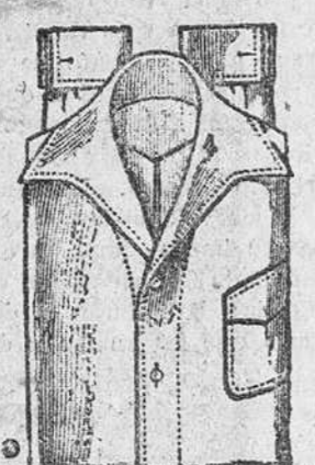
Camisas sport, blanco, crudo y colores, para caballero y jovencitos, a 4, 5, 6, 7 y 10 pesetas.