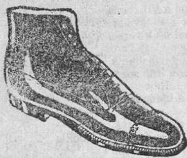
BOTAS Todo cosido a 10'50 pesetas