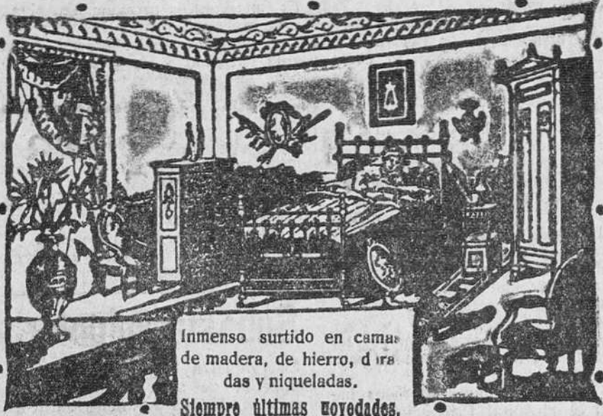
Inmenso surtido en camas de madera, de hierro, de irasdas y niqueladas. Siempre últimas novedades.

Calle de Vitoria, número 14.---BURGOS En esta Casa se vende el sommier "Numaneia"