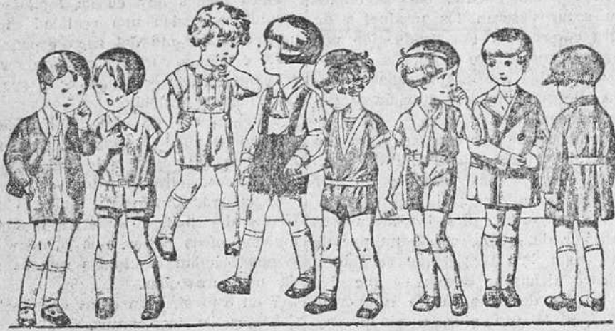
Diversidad de modelos en trapecitos enteros, abriguitos y matalot para niños de dos a cinco años, a 5, 6, 7, 9, 10 y 15 pesetas

Establecimiento oficial del Turing Club Español