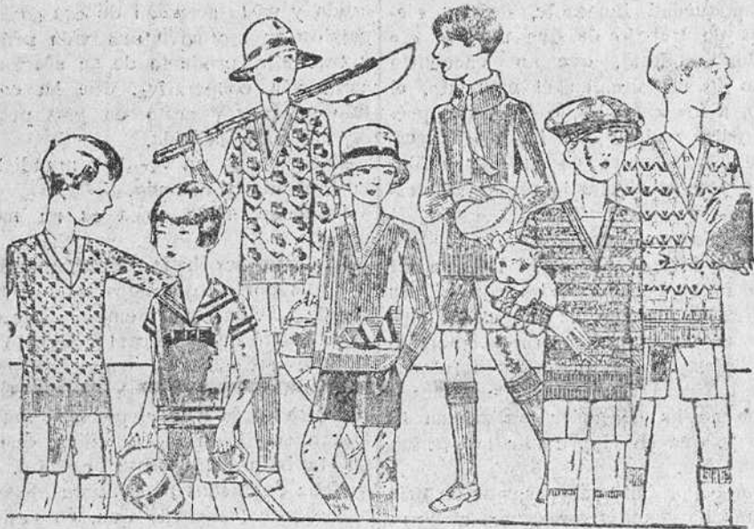
Jerseys de lana o algodón, dibujos y pantaloncitos cortos, en paño, para colores novedad, de 3,50 a 10 pts. doid, de 3 a 7 pesetas uno

Siempre grandes existencias encontrarán en la