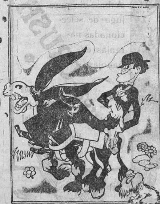
ALADY «El ganso del hongo» que debuta mañana en el Teatro Principal