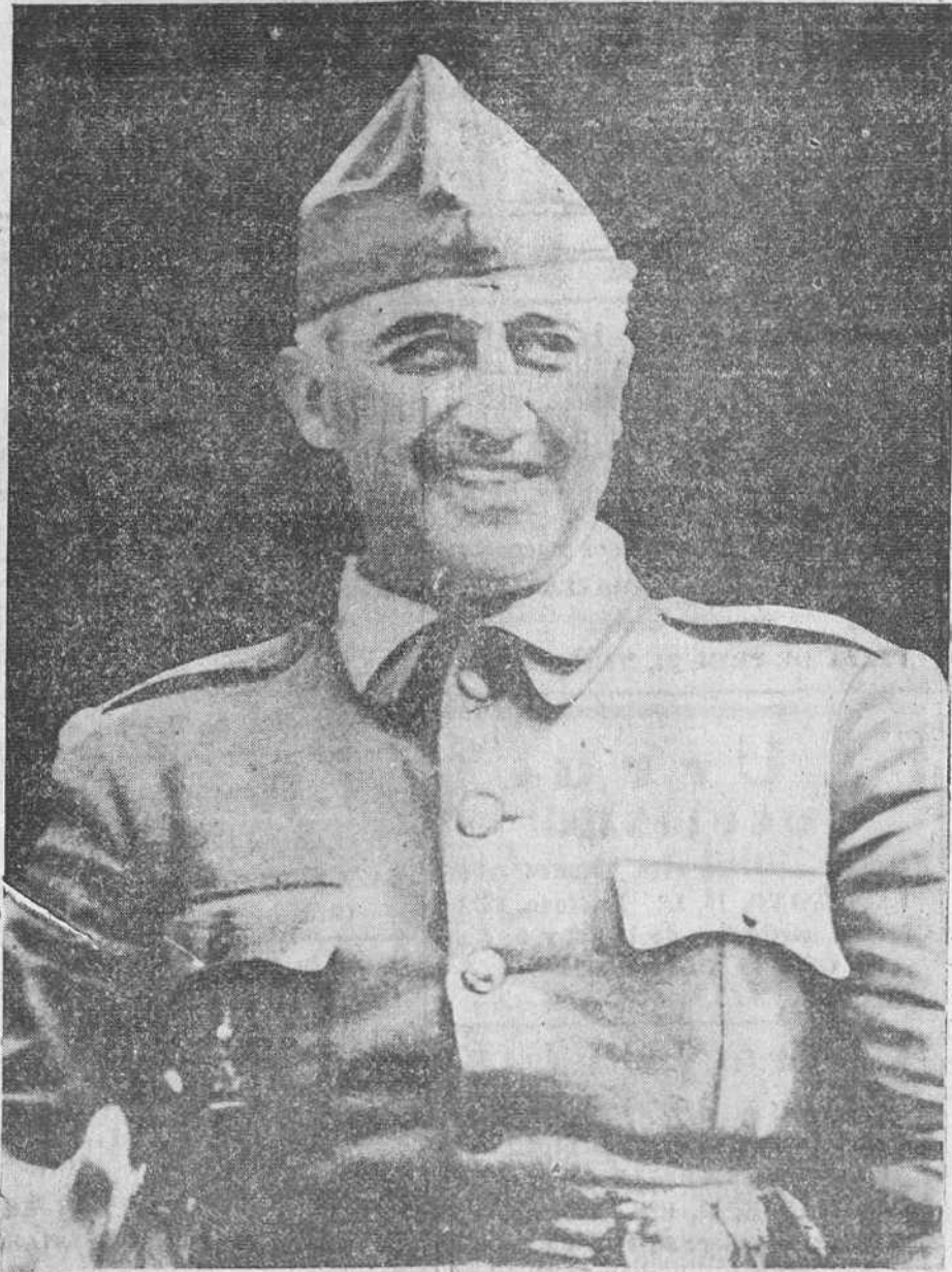
FRANCO, CAUDILLO DE LA NUEVA ESPAÑA, ANTE EL QUE HOY EN EL HISTORICO MONASTERIO DE LAS HUELGAS, JURARON SERVIR A LA PATRIA POR EL IMPERIO HACIA DIOS, LOS CONSEJEROS DE LA FALANGE TRADICIONALISTA

La Nueva España cuesta mucha sangre y mucho dolor con los que nadie puede traficar para su medio.