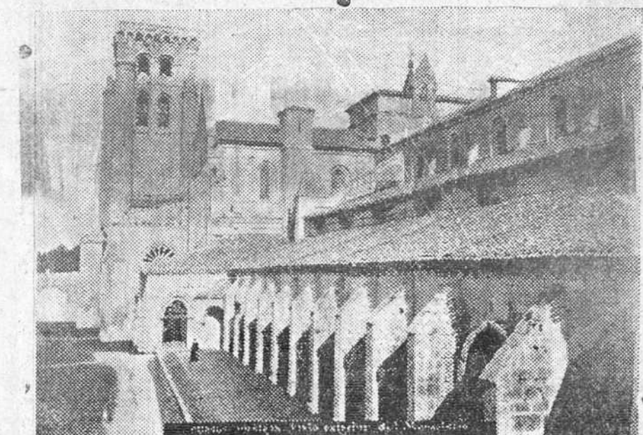
REAL MONASTERIO DE LAS HUELGAS. EN ESTE MARCO, «MEZCLA DE CONSTRUCCION MILITAR Y RELIGIOSA» EL NUEVO ESTADO, RELIGIOSIDAD Y MILICIA, HA RENOVADO EL VOTO QUE EN EL CAMPO DE BATALIA SIRVIO DE NORMA Y GUIA A LOS QUE CAYERON...