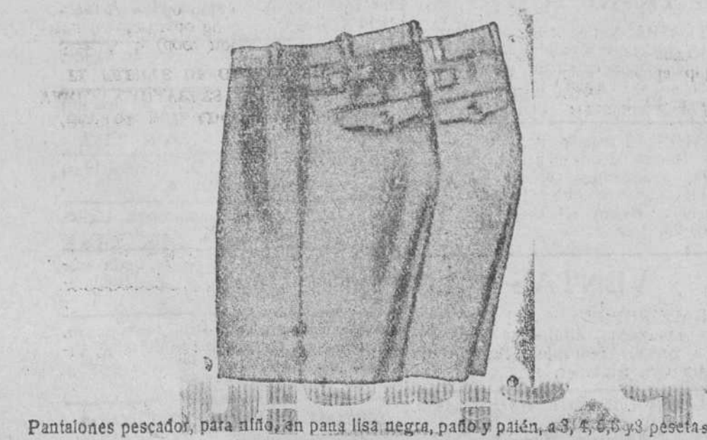
Pantalones pescador, para niño, en pana lisa negra, pado y patén, 4, 5, 6 y 8 pesetas