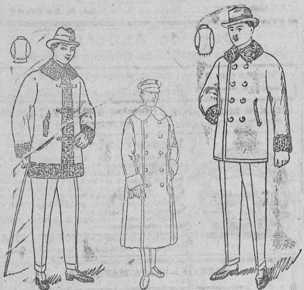
Pelizes paño castor, de rizo alrededor, desde pesetas 50 á 90.

Primera casa en confecciones de caballero, señora, niños y niñas