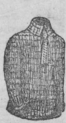
Gerseys lana, á 15, 18, 20 y 25 pts.; de algodón, 6, 7, 8 y 9.