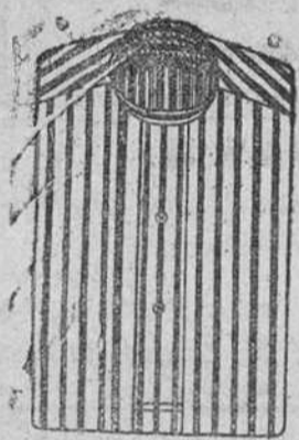
Camiseta percal (tirillo) á 5, 50, 6, 7 y 8 pesetas.