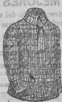
Jerseys corbata á 7, 8 y 9 pis., y sin á 5, 6, 7 y 8.