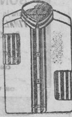
Camisas novedad á 10, 12, 14, 16 y 20 pts

LA CASA más curtidada y que más barato vende en Burgos las camas y muebles es sin duda alguna