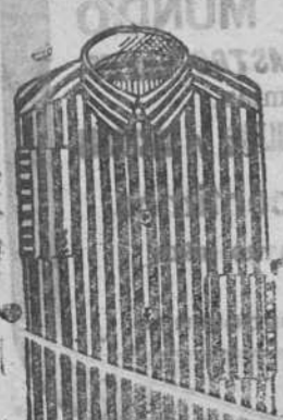
Camisas percal á 7, 8, 9 y 10 pesetas.