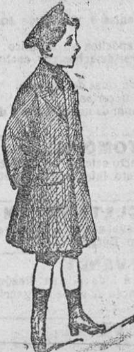
Abrigos de paño para niños, desde 20 á 50 pesetas.