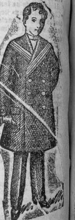
Mieleros para niños, en vicuña azul y negro, desde 25 á 50 pts.