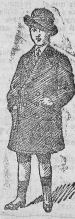
Gabancitos para jóvenes, forma novedad, desde 40 á 90 pesetas.