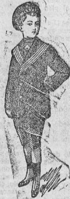
Trajes azules, cascaca, desde 20 á 35 pesetas.