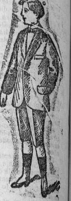
Trajecitos para niños, desde 25 á 30 pesetas.