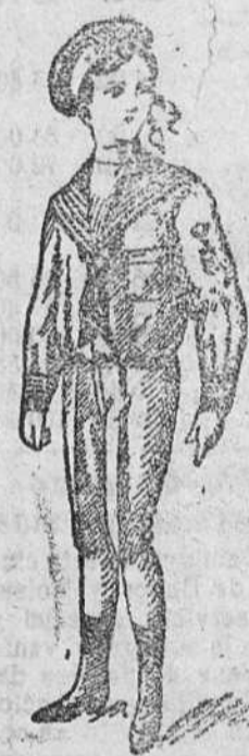
Trajecitos vicuña azul á 15, 17 y 20 pesetas.

Primera casa en confecciones de caballero, señora, niños y niñas